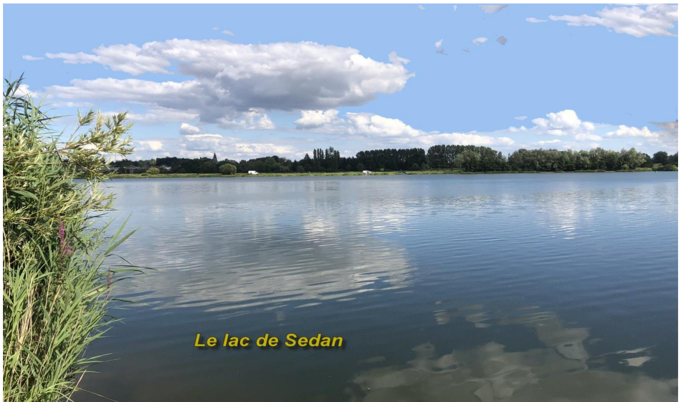
Le lac de Sedan

Epreuve devant respecter le règlement sportif de la Commission Eau Douce de la FFPS